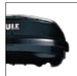
Tecnologia di diffusione