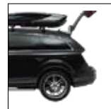
Massimo accesso al bagagliaio