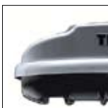
Tecnologia di diffusione