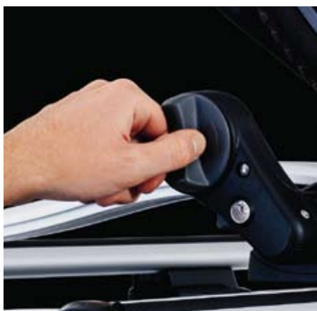
Pomello all'altezza del tetto Tutte le operazioni di regolazione e fissaggio possono essere effettuate all'altezza del tetto.