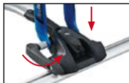
Bloccaforcella Blocca facilmente forcelle di qualsiasi tipo.