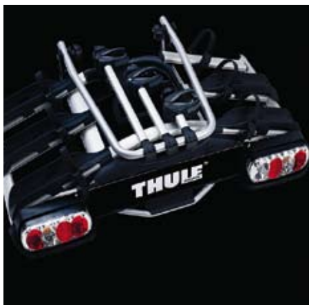
Ripiegabile Facile da ripiegare e riporre.