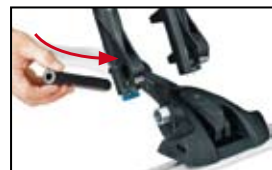
Novità: Adattatore opzionale Per ruote con assali da 15 mm.