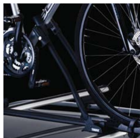
Pinza bloccatelaio regolabile Una volta regolata, la pinza blocca la bici in modo stabile e sicuro.