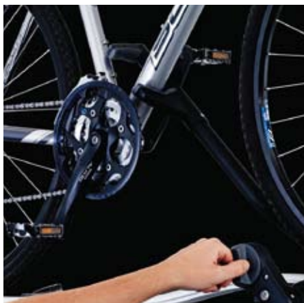
Autoregolante Progettato per portare automaticamente la bici contro la pinza bloccatelaio e bloccarla.