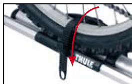
Cinghia a rilascio rapido Mantiene saldamente in posizione la ruota posteriore. Regolabile per adattarsi a ruote di qualsiasi misura.