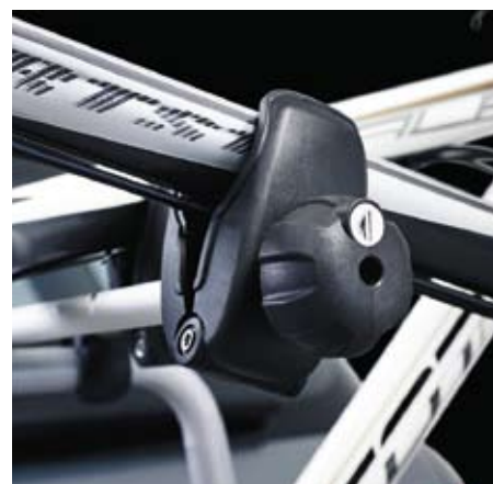
Pinza bloccatelaio amovibile Regolando la pinza bloccatelaio, la bici si blocca in modo stabile e sicuro. La pinza può essere smontata per agevolare il fissaggio dei telai delle bici.