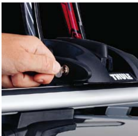
Serratura integrata Blocca la bici al portabici ed il portabici alle barre.