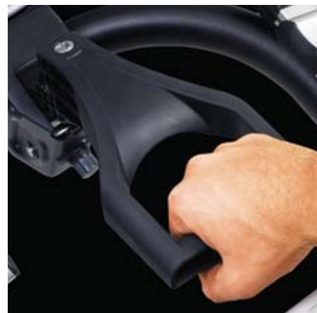
Innovativo sistema di fissaggio Il portabici si fissa al gancio traino semplicemente abbassando l'apposita leva.