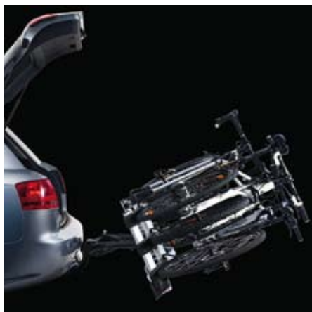
Funzione basculante Permette di abbassare il portabici, anche con le bici caricate, in modo da accedere agevolmente al bagagliaio.