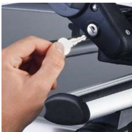
Thule One-Key System Dimenticate la scomodità di avere tante chiavi e passate a Thule One-Key System: un'unica chiave per tutti i prodotti Thule.